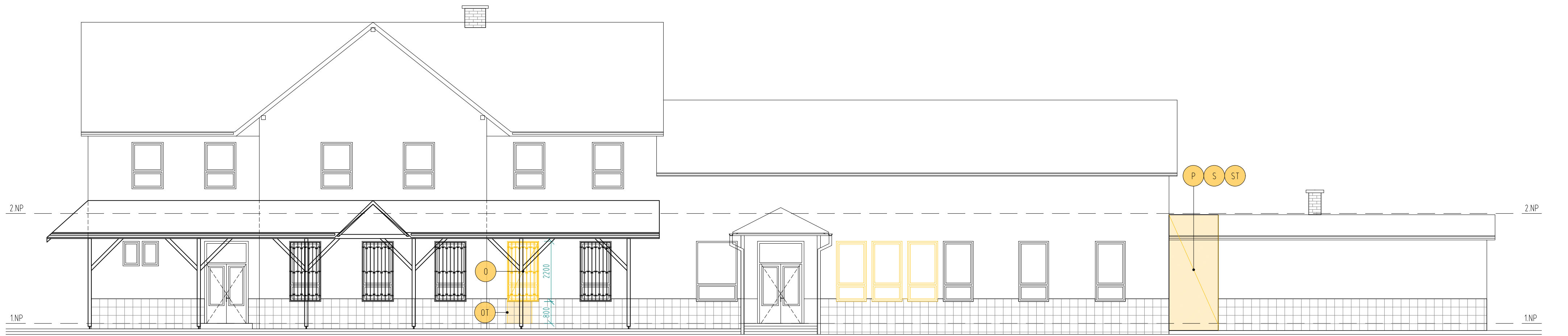
POHLAD JUŽNÝ M 1:100 - STARÝ STAV - BÚRACIE PRÁCE