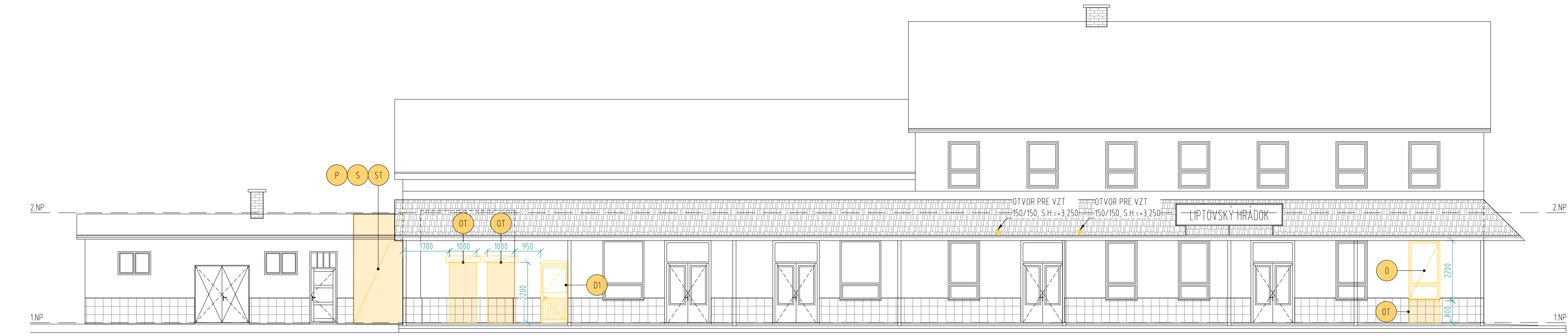
POHLAD SEVERNÝ M 1:100 - STARÝ STAV - BÚRACIE PRÁCE